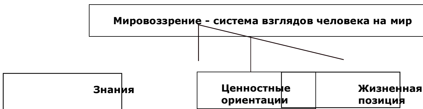
Схема 1. Структура мировоззрения

Прежде чем рассмотреть вопрос о возникновении философии, необходимо уяснить, что такое мировоззрение? Мировоззрение – это совокупность взглядов человека на мир: природу, общество, человека. Важнейшие компоненты структуры мировоззрения – это знания, ценностные ориентации, жизненная позиция.