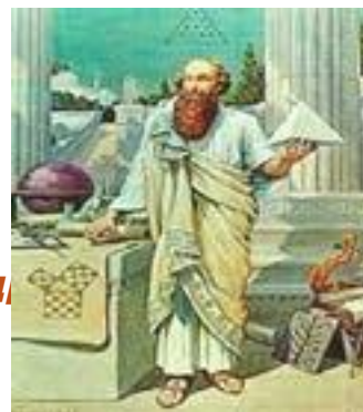
Пифагор (580–500 до н.э.)

«Любовь к мудрости» или «Любомудрость» понимается как «бескорыстное стремление к истине».