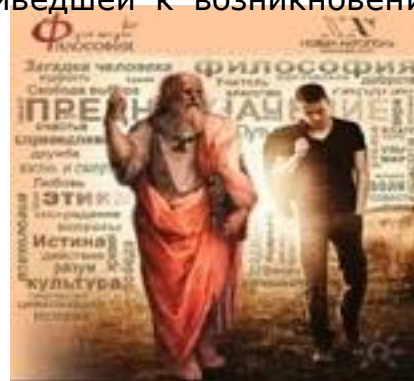
Рис. 2 Милософия и мир

Философия начиналась с осознанной замены мифических образов и символов философскими понятиями (категориями) на основе рационального объяснения мира